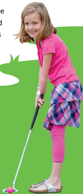
Sydney, de San Antonio

La organización brinda tratamiento sin importar la capacidad de pago de la familia y acepta una gran variedad de seguros médicos, para que todos los niños tengan acceso al mejor tratamiento ortopédico del mundo.